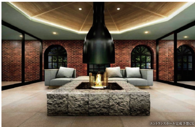
エントランスホール完成予想CG