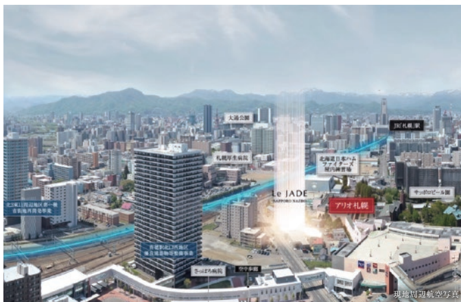
現地周辺航空写真

新都心を形成する大規模再開発が相次ぎ、未来へと進化していく「SAPPORO EASTエリア」。 全邸南東向き・平面駐車場100%完備の総42邸「レ・ジェイド札幌苗穂」誕生。