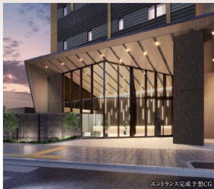
エントランス完成予想CG

名古屋駅まで1駅、 名鉄「栄生」駅徒歩2分の地に誕生！ スタイリッシュなファサードの私邸。 環境に優しいZEH-M orientedを取得